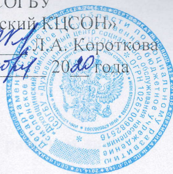
График работы (сменности)